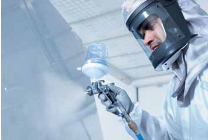
Dokonale sedící tvar – SATAjet 4000 B padne do ruky jako ulitá.