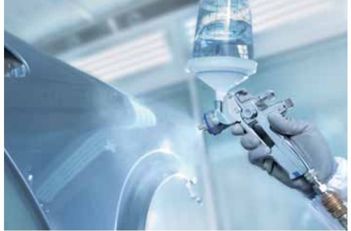
Jemný stříkáč paprsek – SATAjet 4000 B dokonale zvládá dokonce i složité obrysy.