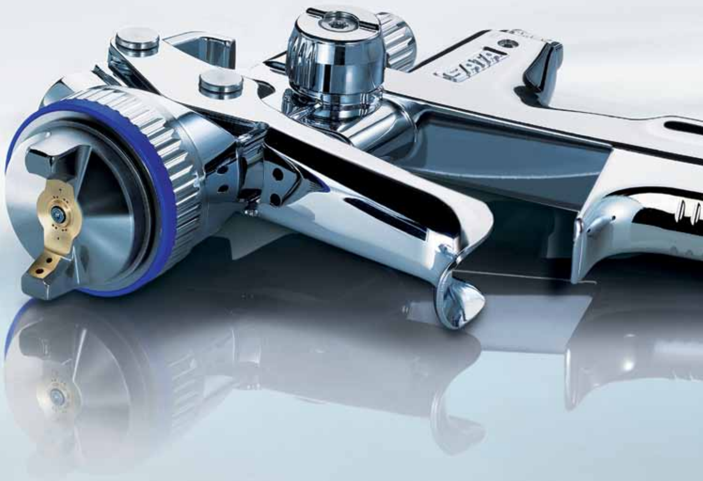
Mít tlak v rukojeti – varianta DIGITAL®: Integrované měření a nastavení tlaku – důležité pro maximální přesnost barevného odstínu.